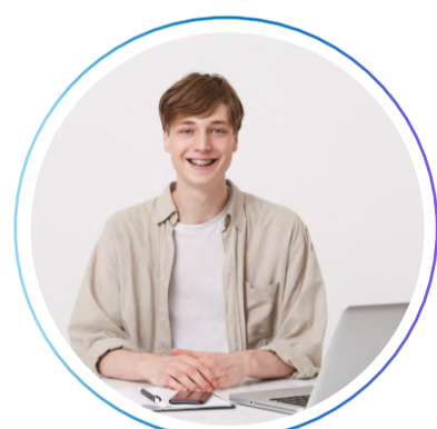
Разработчик СУБД (стажер)