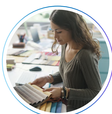
Дизайнер по текстильному оформлению