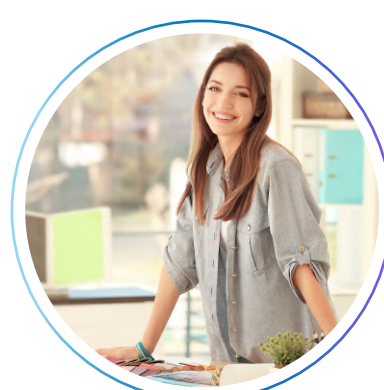
Дизайнер интерьеров и экстерьеров