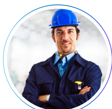
мастер-приемщик слесарного цеха