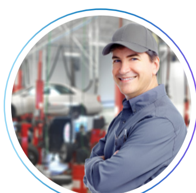
мастер-приемщик кузовного цеха