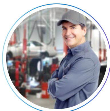
Мастер арматурного цеха