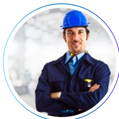
Мастер кузовного цеха (жестянщик)