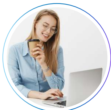
Специалист службы технической поддержки