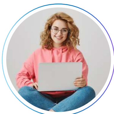
Оператор информационных систем