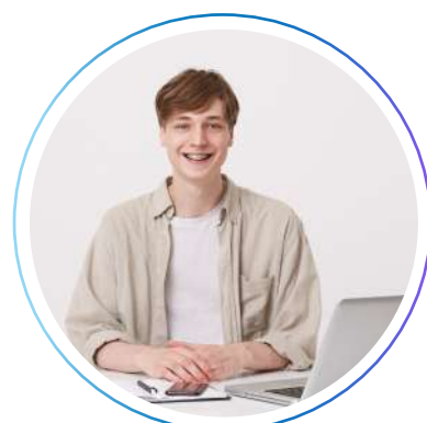
Главный специалист по технической поддержке и внедрению